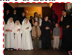
Musical sul beato Francesco Spoto