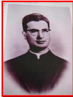
3. “La camicetta rossa l’ha designata per me”