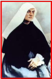
1. “Possa la Chiesa celebrare anche la tua festa”

Certo, “ci brucia” che il nostro amatissimo PADRE, IL NOSTRO SANTO FONDATORE, non possa ancora fare il “salto” e passare la sponda della “beatificazione” per ricevere anche su questa terra l’aureola definitiva che gli spetta, che è sua, che sicuramente nel Paradiso cusmaniano egli da tempo tiene... Forse non basta la santità di Spoto, ci vuole anche la nostra, una santità vissuta, fatta di generosità e quotidianità, di fedeltà, totalità.