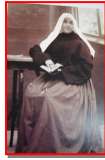
4. “Se non mi faccio santa quest’anno, non mi ci faccio più”