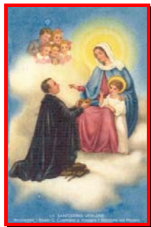
2. “E’al Figlio mio che tu devi tutto”