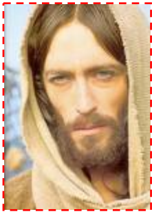
Il "Gesù della storia" è il "Cristo della fede"