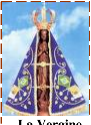
La Vergine "Aparecida" in Brasile