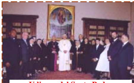
Udienza del Santo Padre Vaticano, 4 maggio 2007

stuale, storico-critica, e l'esegesi teologico-spirituale. « Gesù non è mito ma storia ». Tutta la storia del Dio che muore e risorge "è accaduta realmente"; "Gesù è un uomo fatto di carne e sangue, una presenza reale nella storia", una storia vera: il Papa con il suo libro vuol contribuire a darne la certezza, ricomponendo ad unità i due profili visti in antitesi: il Gesù storico ed il Cristo della fede . L'identità vera della figura di Gesù è nell' unità di una persona che è "storicamente sensata e convincente", pur contenendo in sé una dimensione trascendente. Il metodo usato è storico e teologico insieme, pur prevalendo la lettura teologica, sapienziale, dei Padri della Chiesa.