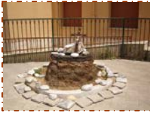
Un momento- simbolo della celebrazione

18 – Palermo, Istituto “M. Immacolata”- Le comunità del Palermitano insieme, in