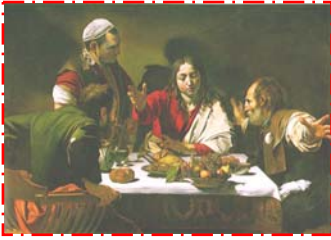
La cena di Gesù ed i discepoli ad Emmaus