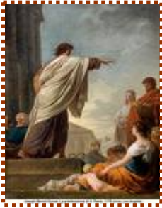
Paolo, apostolo delle genti