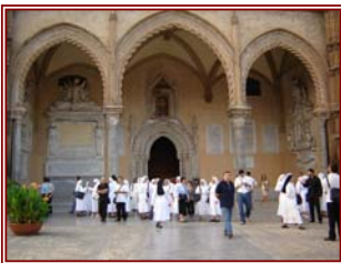
In visita alla Cattedrale di Palermo