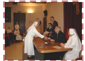
Consegna degli attestati

Quindi, la Concelebrazione eucaristica conclusiva, ancora una volta attorno alle sacre spoglie del Fondatore e di Madre Vincenzina. Poi un pranzo conviviale, amabilmente offerto dalla Comunità di Terrerosse e festosamente partecipato da tutti i corsisti.