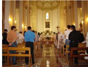
Incontro di preghiera a San Marco