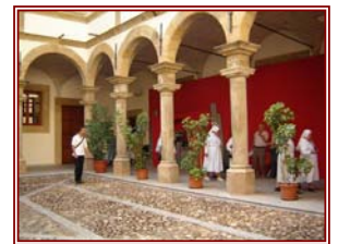
Atrio della Facoltà teologica