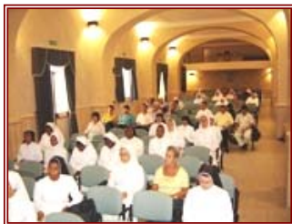
Durante una lezione