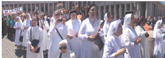
Figure di santità

A Roma, dal 23 al 30 giugno, si è svolto un altro turno di convegno ed esercizi. Nella capitale, le Suore partecipanti, hanno avuto la possibilità di prender parte all'angelus di Papa Francesco, il quale ha esortato i fedeli, dicendo: “Non abbiate paura di andare controcorrente, quando ci vogliono rubare la speranza, quando ci propongono questi valori che sono avariati, valori come il pasto andato a male e quando un pasto è andato a male, ci fa male; questi valori ci fanno male. Dobbiamo andare controcorrente!” . Anche questo momento è stato accolto come un dono di Dio, all'inizio dell'itinerario formativo umano-spirituale-carismatico che successivamente si è svolto.