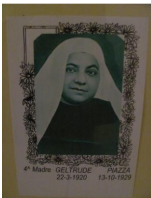
Figure di santità

Il 27 settembre celebreremo San Vincenzo De' Paoli, tanto ammirato dal nostro amato Fondatore, che ne fu edificato; lo invocheremo affinché possiamo anche noi essere spronati all'esercizio della Carità.